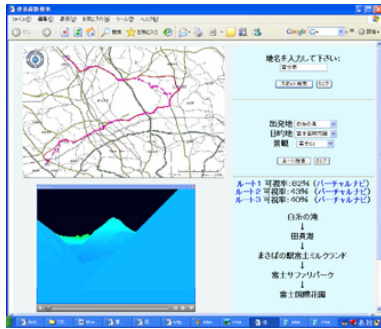
図2 インタフェース(左下にムービーを自動表示). Fig.2 GUI interface(movie at left below area)